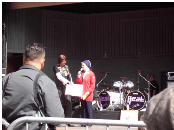
Överlämnande av check till Röda Korset till projektet "Rädda Mammorna"