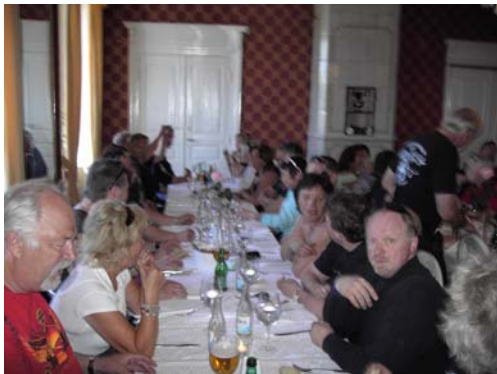
Lunch på väg till Fiskeboda!!!!