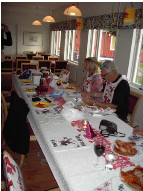
Kräftskivan, var resten är vet jag inte!!