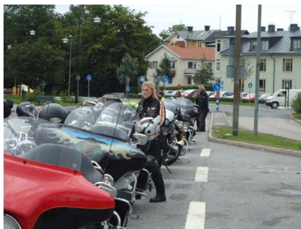
Ett stopp i Waxholm med tyskarna.

Sedan har säsongen bjudit på besök av 22 hoggare från Tyskland "Neckar-Nagold-Chapter". De kom den 5 augusti och då var vi några stycken som mötte upp och ledsagade våra gäster till vår huvudstad från Järna / Södertälje. Efterföljande lördag var vi flera som mötte upp våra besökare i butiken innan det var dags för en sedvanlig lördagstur i det vackra Roslagen.