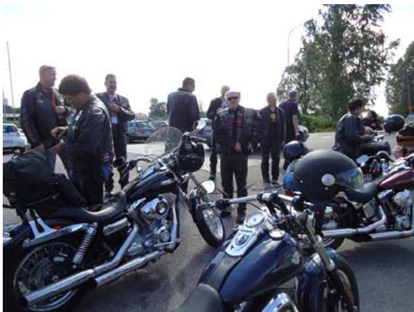
På väg upp till Åre

Nytt för i år har varit att vi delat på Lördagsturerna med Stockholm Syd.