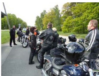
På väg till Herrfallet