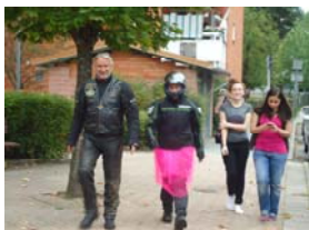
Vår HRC vid en möhippekörning