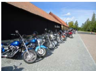
MC Collection 4 sept