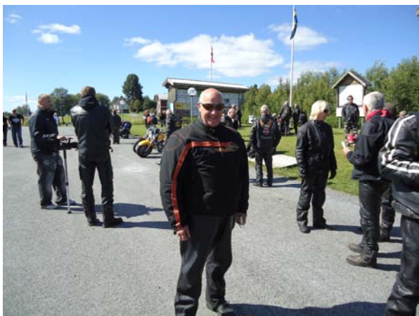
Samling i Mattmar inför Cortegekörning till Åre.

Sedan följde Rallyt i Åre och efter förfrågningar från andra chapter om det skulle bli någon gemensam samlingspunkt, och stort jobb från Jämtlands Chapter så blev det till slut en sagolik upplevelse med ca 200 som deltog i "bara" själva Cortegen in till Åre från Mattmar.