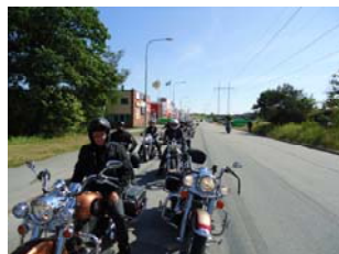
På väg till Iron Horse Show