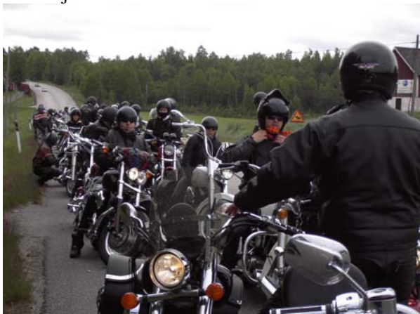
Ett litet stopp på väg upp mot Norrtälje.

Årets åksäsong har i år varit lika upplevelserik och rolig som andra år. Deltagarantalet har varit ungefär desamma, ibland är vi några och ibland är vi några fler och ytterligare ibland är vi riktigt många. Som i år när vi drog upp till Norrtälje och slog rekord med 140 deltagare som åkte från Sveavägen och HD Citybutiken för att se Norrtälje Bike Show.